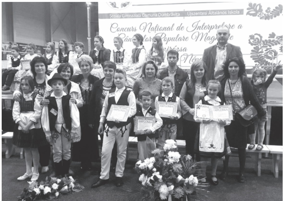
Maros megyei gyerekek, pedagógusok, szülők