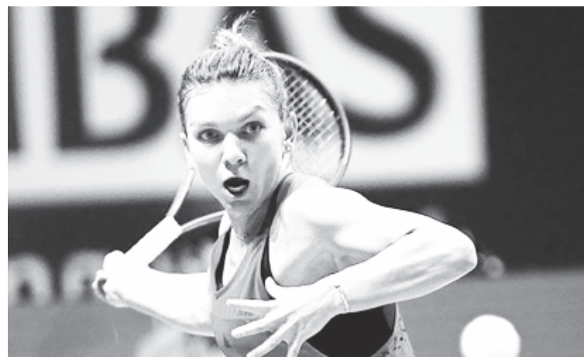
Simona Halep győzelemmel kezdett Szingapúrban

* WTA-világbajnokság, Szingapúr, eredmények: Vörös csoport, 1. forduló: Simona Halep (román) – Caroline Garcia (francia) 6:4, 6:2, Caroline Wozniacki (dán) – Jelina Szvitolina (ukrán) 6:2, 6:0; Fehér csoport, 1. forduló: Karolina Pliskova (cseh) – Garbine Muguruza (spanyol) 6:2, 6:2, Venus Williams (amerikai) – Jelena Ostapenko (lett) 7:5, 6:7 (3-7), 7:5; 2. forduló: Pliskova – Williams 6:2, 6:2, Muguruza – Ostapenko 6:3, 6:4.