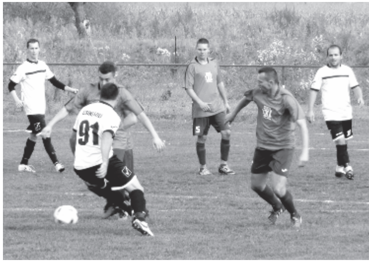
Mindkét csapat hullámzó teljesítményt nyújtott, végül a hazaiak szereztek gólt és pontokat.

A második játékrész a vendégek helyzetével kezdődött, Kovács jutott fel a hazai kapuig, de közeli próbálkozását Prodán kivédte. Ettől kezdve a hazaiak visszavették a játék irányítását, a vendégeknél a pályára küldött cserejátékosok sem produkáltak a kívánt teljesítményt. A hazaiak támadásai a 76. percben meghozták az eredményt: Csíki S. egy 18 méteres szabadrúgásból áttemelte a labdát a rosszul beállított sorfal fölé, és a rövid sarkokba csavart, a hazaiak nagy öröme (1-0). Öt perc múlva a vendégek egyenlíthettek volna, de Prodán nagyot védett egy közeli lövésénél, majd Csoma szabadrúgását is elcsípte. Az utolsó sípszóig már csak egyetlen hazai próbálkozást jegyezhetünk, Keresztesi lövése azonban elkerülte a vendégkaput.